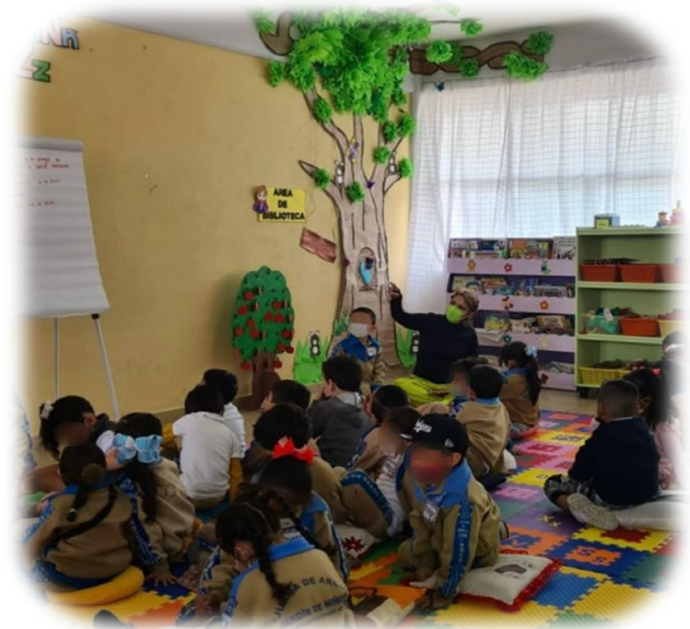
Imagen 2. Aplicación de la estrategia de "Recomendaciones".