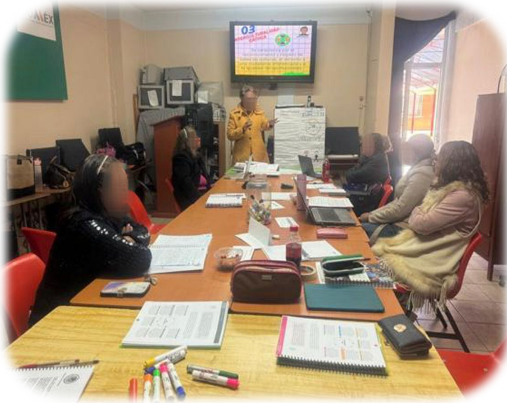
Imagen 1. Sesión de CTE con el colectivo escolar.

En esta acción, la docente apoyó en mi intervención escribiendo en el rotafolio las ideas centrales que las y los niños proponían para integrar la recomendación de la lectura del cuento revisado que fue, Willy el campeón , de Brown, A. (1985), de la colección Biblioteca de Aula, para