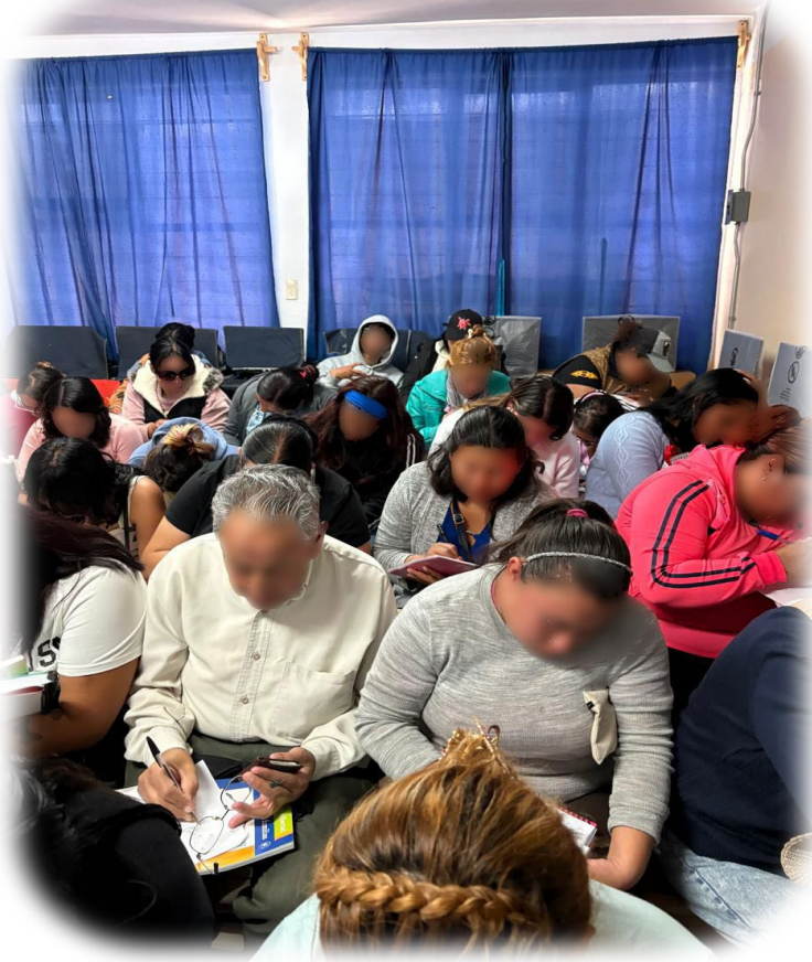
Imagen 4. Taller con padres de familia "Crianzas para la libertad".

Mi intervención como Supervisora ha evolucionado hacia un enfoque más colaborativo, en donde el acompañamiento pedagógico ha sido clave en esta resignificación, pues se ha priorizado el apoyo a docentes bajo el enfoque de la NEM, y para ello mi colaboración en el CTE ha sido fundamental ya que se impulsó la reflexión crítica del colectivo escolar con relación a sus prácticas y el enfoque siempre se centró en mejorar los aprendizajes de las y los estudiantes. Por otra parte, bajo el enfoque de territorialidad se adaptaron estrategias al contexto específico de la escuela y la relación con el colectivo se volvió más horizontal, en donde permea una comunicación entre pares, lo que permitió desarrollar una mejor forma de dialogar. Considero que el acompañamiento brindado, empoderó al colectivo docente para innovar, este proceso se dio en el momento en que, dentro del desarrollo de su práctica reflexiva, las y los docentes manifestaron argumentos pedagógicos con sentido y con elementos teórico-metodológicos. A partir de esta experiencia, considero que el futuro de la Supervisión escolar en el país, alineado con la NEM, podría estar marcado por transformaciones que potencien la excelencia educativa, la sinergia y la colaboración.