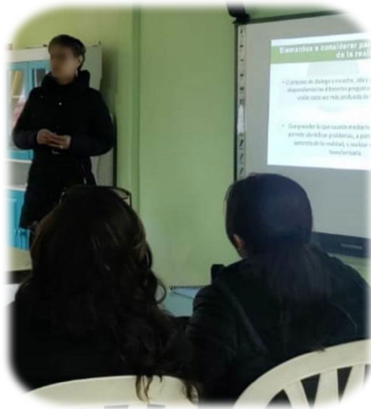
Imagen 3. Asesoría al colectivo sobre estrategias de lectura

Desde mi punto de vista se logró un trabajo colaborativo, de intercambio y de diálogo horizontal con un enfoque transformador, ya que nos retroalimentamos y fortalecimos como una comunidad de aprendizaje.