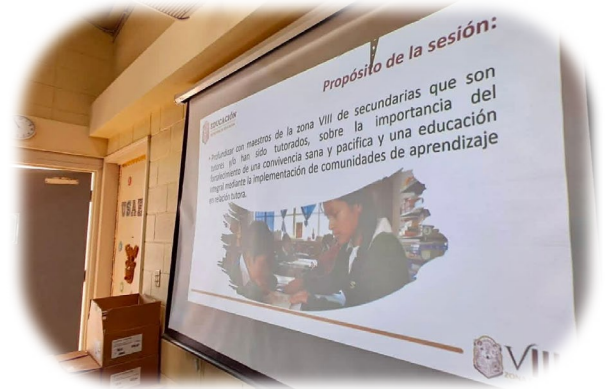
Imagen 3. Directivos ejerciendo su autonomía profesional y decidiendo implementar la metodología de la Relación Tutora.

Es importante resaltar que, como parte del acompañamiento y seguimiento que brinda la Supervisión escolar, se busca identificar y analizar los procesos que favorecen una mejor implementación de la NEM. En este sentido, al colocar en el centro la relación dialógica desde el acompañamiento, se modela la importancia del diálogo como herramienta pedagógica y como medio para transformar lo que sucede en el aula, promoviendo así la construcción de comunidades de aprendizaje, donde la RT constituye un medio para su consolidación.