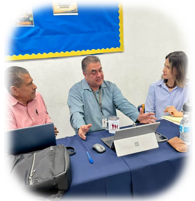
Imagen 4. Diálogo entre directivos de escuelas que implementan la Relación Tutora desde hace varios años.

Al inicio de cada ciclo escolar se diseña el Plan de Trabajo de la Zona escolar, atendiendo las necesidades identificadas, considerando el contexto sociocultural y geográfico. A partir de los diagnósticos socioeducativos que cada escuela elabora, se presentan propuestas de intervención desde la supervisión; en este caso, la creación de las CART tiene el propósito de favorecer la independencia, el aprendizaje autónomo, la seguridad, el pensamiento crítico y las relaciones de colaboración, todo ello basado en el diálogo tutor. Cada escuela determina si cuenta con las condiciones necesarias para implementarlas. Desde la supervisión, se brinda acompañamiento directo a las y los estudiantes que aceptan el reto de participar en el proceso de tutoría, con la finalidad de que se formen como tutores.