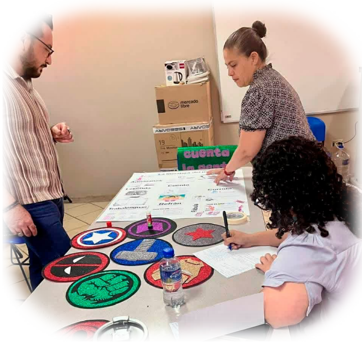
Imagen 6. Tutores profundizando en el tema a través de la investigación independiente.

Este ejercicio fortalece el aprendizaje autónomo, ya que el tutor previamente orientó su proceso de indagación mediante el diálogo tutor.