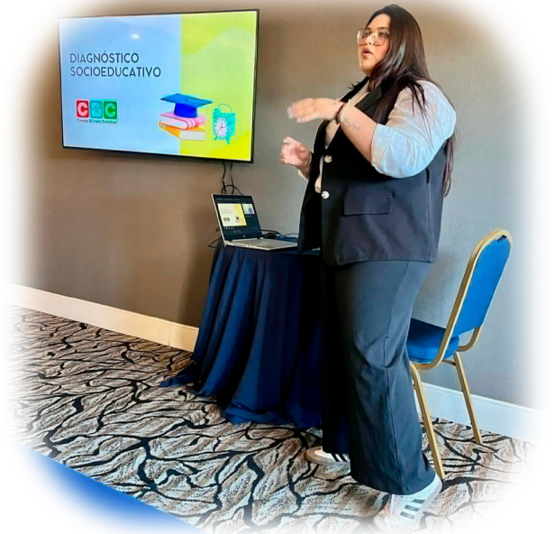
Imagen 1. Análisis de los diagnósticos socioeducativos en el Consejo Técnico de Zona para la elaboración de los Programas de Mejora Escolar.

No obstante, a partir de los diagnósticos socioeducativos realizados en la Zona escolar 8, se identificó como problemática central la dificultad de alumnas y alumnos para trabajar de manera colaborativa, así como limitaciones en la comprensión lectora y el razonamiento lógico-matemático, situación que incide en su desempeño académico y en su participación activa en el aula. A ello, se suma un contexto caracterizado por situaciones de violencia que impactan en la convivencia escolar.