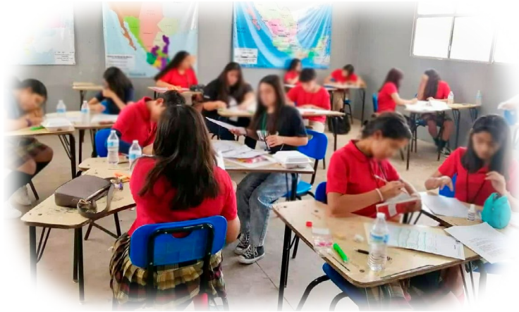
Imagen 2. Estudiantes implementando la Relación Tutora.

En este sentido, la Relación Tutora (RT) entre estudiantes parte de la creencia de que todas las personas tienen la capacidad de aprender, considerando que cada una lo hace a su propio ritmo, respetando sus procesos de razonamiento y la construcción de conocimiento. De igual manera, se basa en el principio de compartir únicamente aquello que se ha aprendido con suficiencia, favoreciendo así la autonomía y la apropiación significativa del aprendizaje.