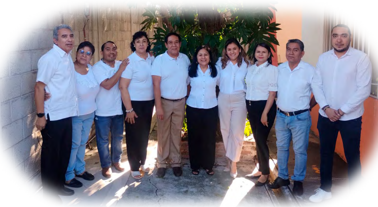
Imagen 6. Consejo Técnico de la Zona 130.

Aún existe la necesidad de seguir trabajando en la construcción del PA, profundizar en el propósito de los Ejes articuladores, el alcance del perfil de egreso y en una mayor comprensión de las metodologías socio críticas, así como mantener actualizado el dispositivo USB ante las nuevas ediciones de los LTG; sin embargo, el camino académico que se ha implementado entre los directivos y docentes frente a grupo seguramente plantearan nuevas necesidades para ser atendidas bajo esquemas de asesoría y/o acompañamiento, lo que mantiene la certeza de continuar la labor de supervisión con la firme convicción de seguir incidiendo en cada escuela y en cada aula, en los procesos de enseñanza y en los de aprendizaje, a fin de obtener logros académicos más auténticos y contextualizados que permitan ofrecer una educación más humanista, más integral y transformadora al interior de la Zona Escolar 130.