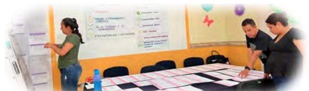
Imagen 2. Alineación por Fase de Contenidos-PDA, por Campos formativos.

A efecto de apoyar a las y los docentes para facilitar la elaboración del PA en cada plantel, la Supervisión escolar dio el primer paso: Conformar un concentrado que incluyera de manera precisa el propósito general, los propósitos específicos, la tabla de Contenidos contemplados en el Programa Sintético en cada uno de los Campos Formativos y la propia Alineación de contenidos con los Procesos de Desarrollo de Aprendizaje (PDA) de las Fases de estudio 3, 4 y 5. Para ello, se conformó un pequeño equipo integrado por personal administrativo y un Asesor Técnico Pedagógico (ATP), quienes trabajaron dentro y fuera de la jornada escolar, durante el mes de octubre del año 2024, bajo la coordinación de la Supervisora escolar.