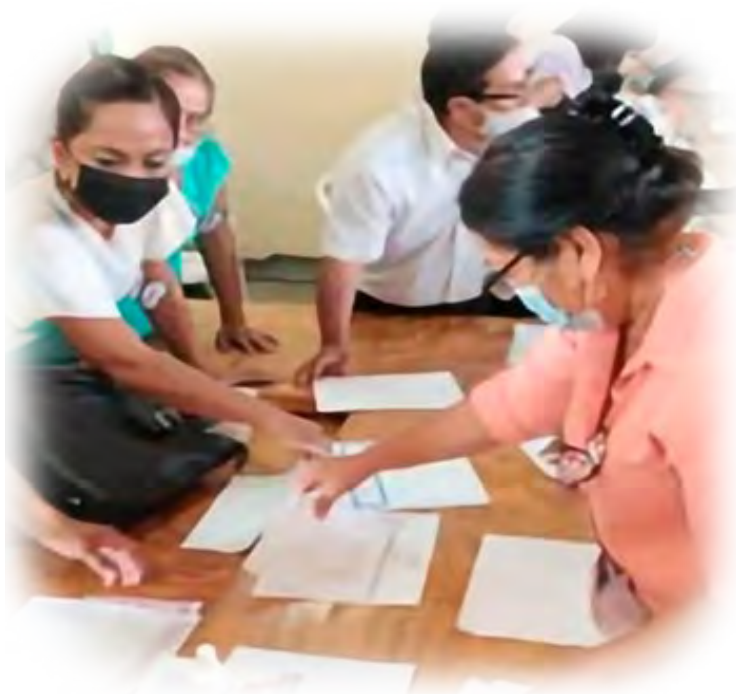
Imagen 5. Encuentro entre pares. Relacionando contenidos con familia de Libros de Texto Gratuitos.

Una situación académica que se generó durante este trabajo fue que los colectivos docentes plantearon la necesidad de elaborar otra alineación, ahora entre Contenidos-Familia de Libros de Texto Gratuito (LTG) con el propósito de facilitar las planeaciones de clase. La necesidad fue considerada como un reto y fue aceptada con agrado y convencimiento por parte de las y los docentes. Así, se distribuyeron Contenidos del Programa sintético para ser relacionados con los LTG de cada Fase de estudio con la intención de registrar las vinculaciones que encontraran y socializarlas en el próximo encuentro.