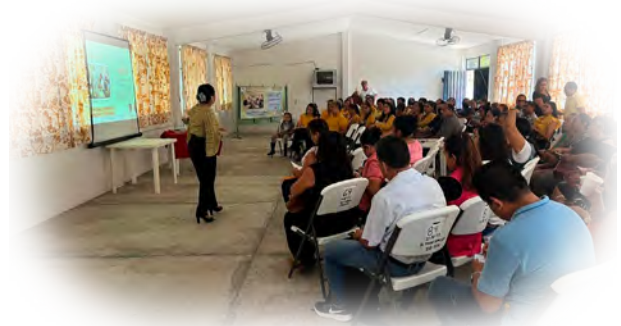
Imagen 1. Conversatorio sobre el Programa Analítico.

realizada entre directivos, se reconoció como una acción muy productiva y necesaria que logró redireccionar las nociones iniciales del PA y el beneficio de elaborarlo entre el colectivo de cada escuela, con una perspectiva incluyente y de coparticipación.