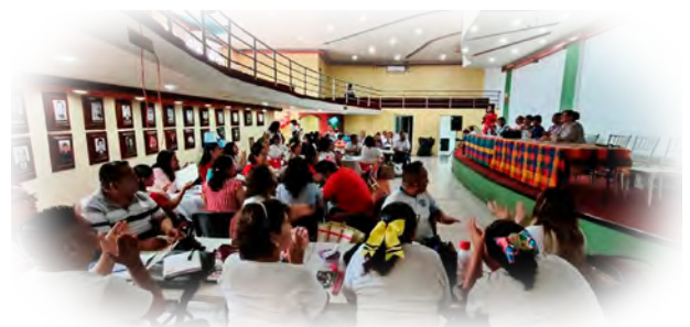
Imagen 4. Plenaria de zona para socialización de prácticas situadas.

Lo más significativo de esta estrategia fueron los acuerdos colectivos generados, en los que, a partir del uso de la creatividad y la participación activa, surgieron nuevas ideas orientadas al fortalecimiento de la práctica educativa.