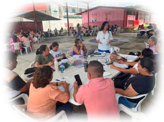
Imagen 1. Lectura de la realidad con la Zona escolar 044.

desempeño y orientan sobre lo que se espera en cada nivel.