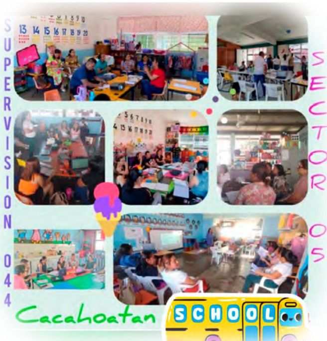
Imagen 2. Fortalecimiento de los Consejos Técnicos Escolares.

Como resultado, se logró mejorar el servicio educativo que prestan las escuelas, enfocando sus actividades en el logro de los aprendizajes de todos sus NN, fortaleciendo el trabajo colaborativo en cada institución y estableciendo acciones, compromisos y responsabilidades de manera colegiada, por ejemplo, en la planificación todos tienen una tarea específica, lo que realizará cada quien, en qué momento y cómo lo llevará a cabo, asignando las responsabilidades de acuerdo a sus habilidades y con la participación de toda la comunidad escolar. Del mismo modo, se fortaleció el desarrollo profesional del personal docente y directivo en función de las prioridades y necesidades educativas de cada escuela, impulsando el proceso de mejora continua como una práctica permanente. Esto permitió priorizar la atención a problemáticas específicas mediante la transformación de la práctica docente y de gestión escolar, liderada por los directivos, e implementar situaciones didácticas basadas en el juego y la exploración, fortaleciendo la oralidad, el pensamiento crítico y la curiosidad científica.