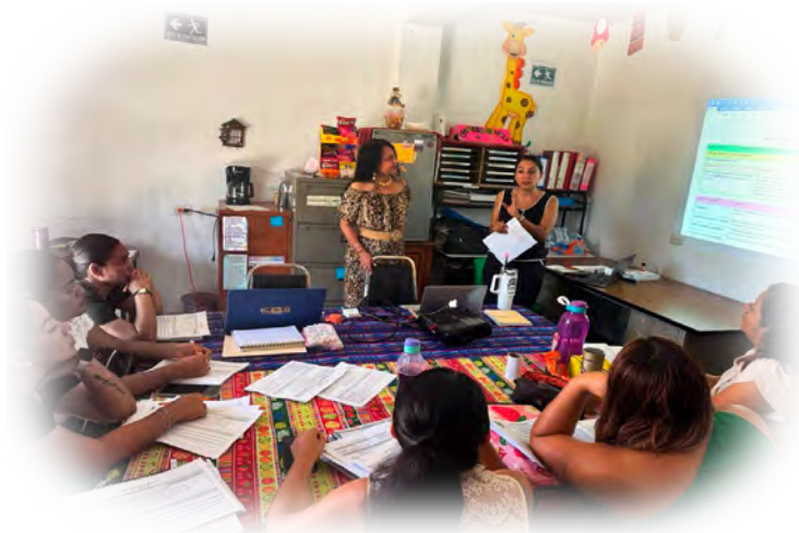
Imagen 3. Formación directiva en el diseño del plano didáctico.

Finalmente, al implementar el trabajo en el aula, se brindó acompañamiento a directivos y docentes mediante sugerencias y estrategias basadas en diversas metodologías y modalidades de trabajo, fortaleciendo así la práctica pedagógica.