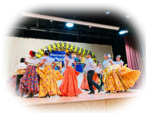
Imagen 2. Expresión Artística y Desarrollo Integral: Muestra de Danza en la Jornada Cultural.

de la expresión estudiantil de la Zona escolar 09. La evaluación de la oratoria se realizó mediante jurados expertos bajo rúbricas de competencia comunicativa, mientras que la muestra de talentos (bailables regionales y danza) fortaleció la identidad cultural. Al realizarse todas las actividades en esta sede única, se garantizó un impacto comunitario masivo y se optimizó la movilidad de las 16 escuelas, consolidando un foro de convivencia y aprendizaje sin precedentes en la región.