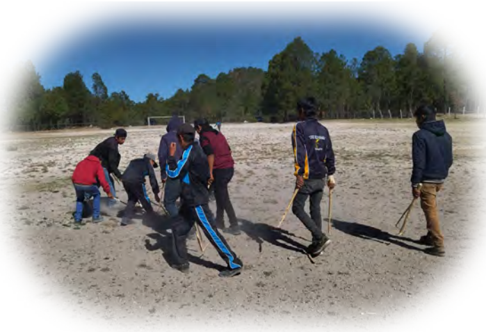
Imagen 3. Interculturalidad Crítica y Rescate Cultural: Exhibición de Juegos Tradicionales.

al reconocer y celebrar las prácticas de la juventud indígena y rural, transformando el evento deportivo en un espacio auténtico de inclusión e identidad territorial.