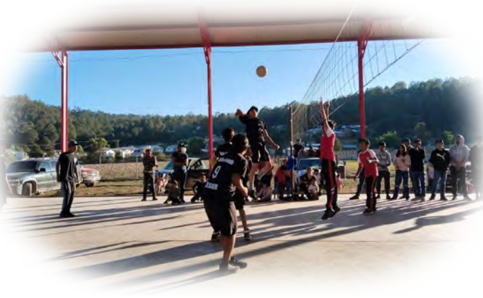
Imagen 4. Vida Saludable y Convivencia: Competencia Deportiva

El impacto de la estrategia de acompañamiento implementada en la Zona escolar 09 de Telesecundarias, a través de la Jornada Integral, es multidimensional y se vincula directamente con la función de la Supervisión escolar como impulsora del cambio pedagógico, evidenciando avances significativos en los ámbitos pedagógico, institucional y social.