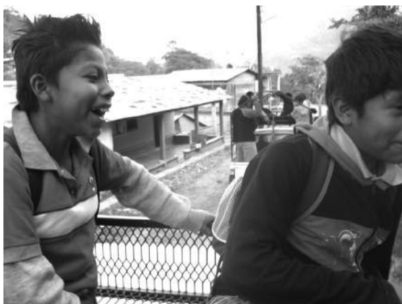
Viajando en camionetas

Mientras los chicos practicaban en clase las estrategias de lectura de textos informativos, y después de