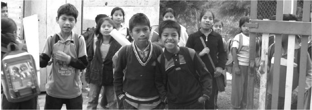
Rumbo al zoo