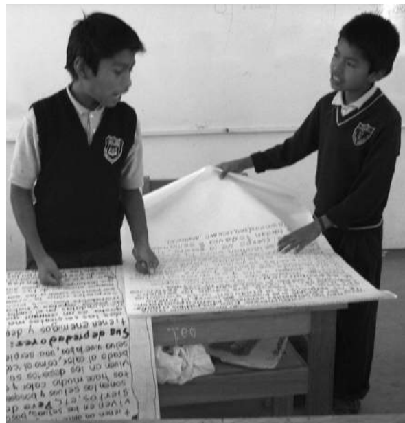
Preparando la exposición