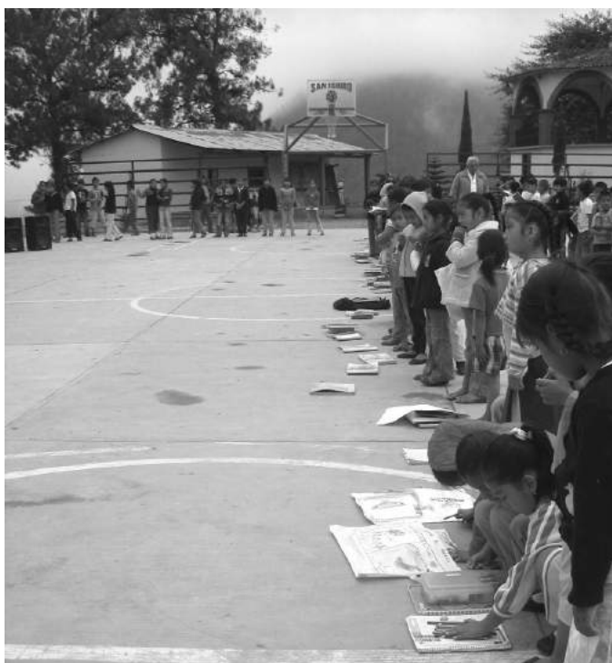
Inauguración de la biblioteca

Una vez instalada la biblioteca y en funcionamiento, estaba lista para adentrarnos en sus laberintos. Así que primero